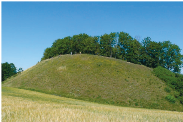
Góra św. Wawrzyńca to wał obronny Chełmna - jego pierwszej lokalizacji w X wieku

Po utworzeniu w 1000 r. metropolitalnej struktury organizacyjnej Kościoła w Polsce ziemia chełmińska weszła w skład archidiecezji gnieźnieńskiej. To czas pierwszej ewangelizacji poczynając od elit politycznych. Głównym ośrodkiem był gród w Chełmnie, gdzie Bolesław Chrobry rozpoczął budowę katedry dla biskupa misyjnego, który miał kontynuować ewangelizację pogańskich plemion pruskich.