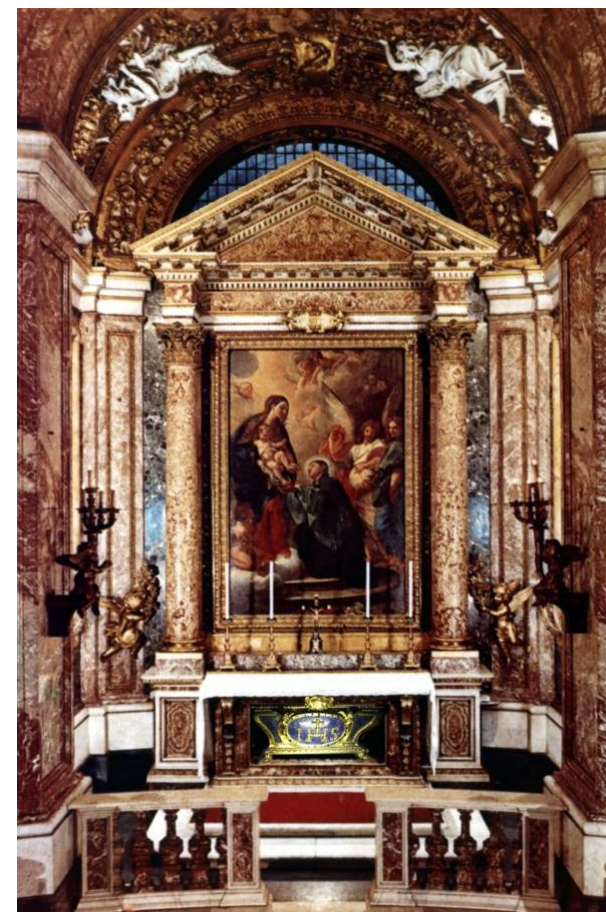
Trumna z ciałem św. Stanisława Kostki w rzymskiej świątyni św. Andrzeja na Kwirynale