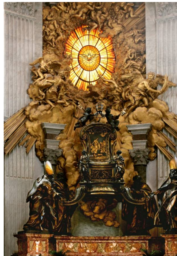
Katedra św. Piotra w bazylice watykańskiej pod opieką Ducha Świętego