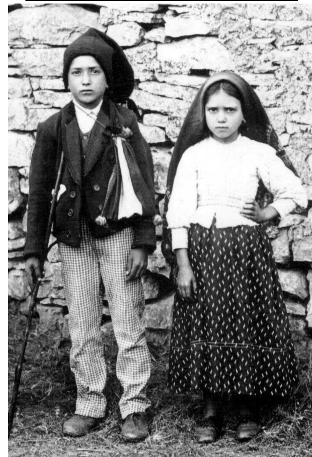
św. Franciszek i św. Hiacynta