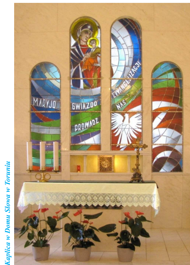
Kaplica w Domu Słowa w Toruniu