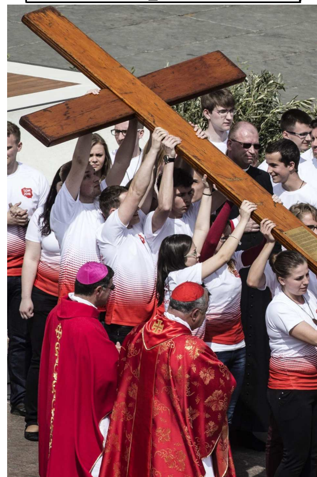
Polska młodzież przejmuje krzyż ŚDM