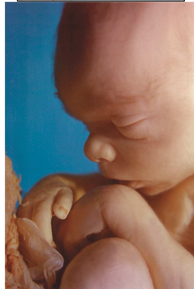
Dziecko w piątym miesiącu od poczęcia