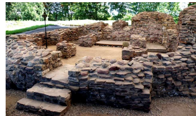
Zachowane fragmenty baptysterium w którym został ochrzczony Mieszko I wraz z mieszkańcami grodu