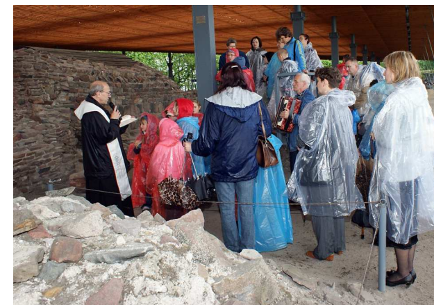
Odnowa przyrzeczeń chrzcielnych