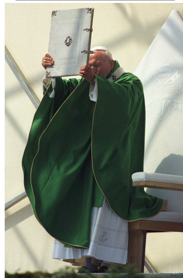
Jan Paweł II w Pelplinie