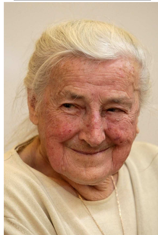
Dr Wanda Półtawska