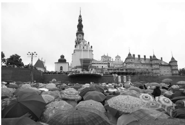
Żywy Różaniec na Jasnej Górze w 2013 r.