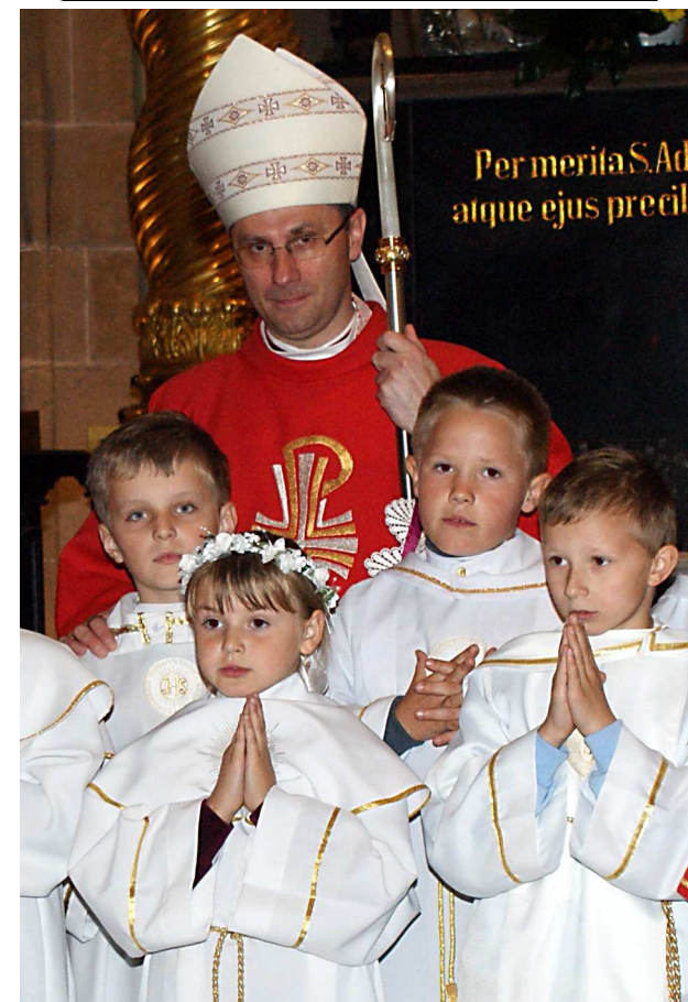
Prymas Polski ks. abp Wojciech Polak z dziećmi z naszej diecezji