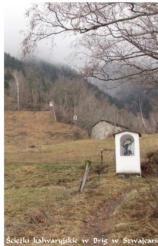
Ścieżki kalwaryjskie w Brig w Szwajcarii