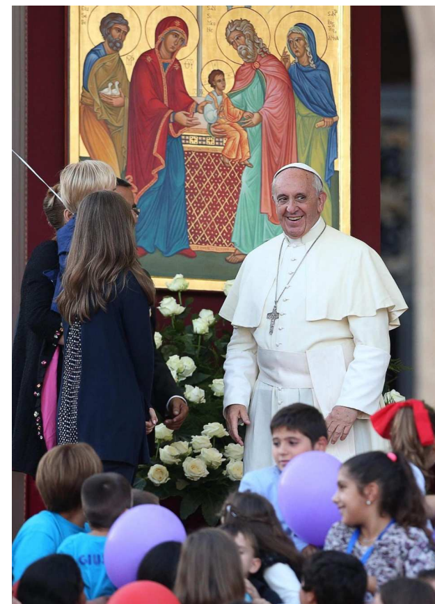
Ojciec Święty Franciszek podczas spotkania z rodzinami w Roku Wiary