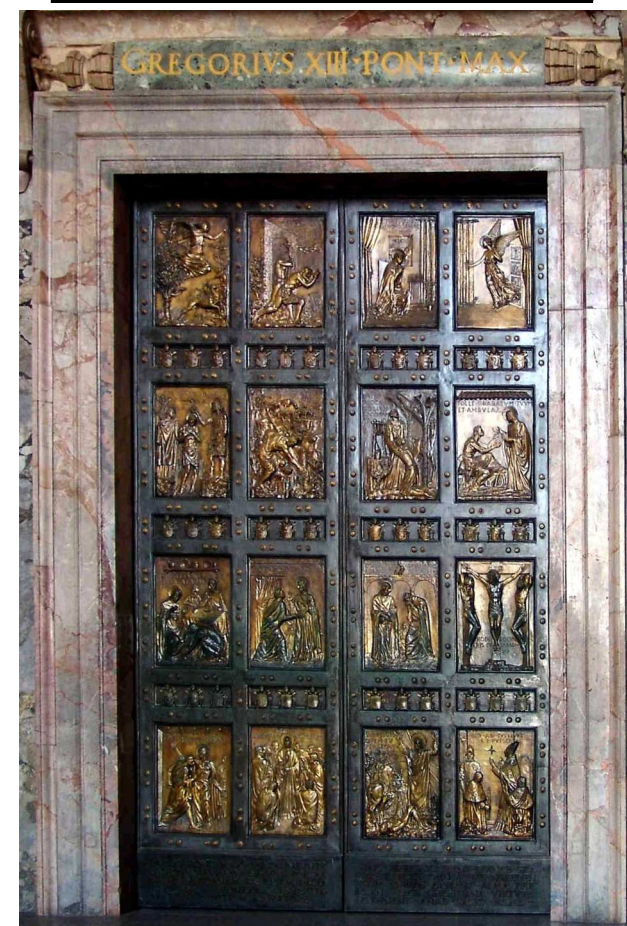
Drzwi Święte w bazylice św. Piotra