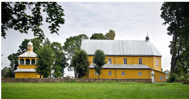
Kościół parafialny w Taboryszkach