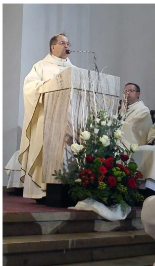
o. Tadeusz Rydzik podczas uroczystości XXI-lecia Radia Maryja